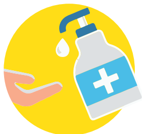
USO DE GEL HIDROALCOHOLICO