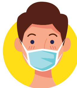
USO DE MASCARILLAS