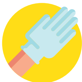
USO DE GUANTES